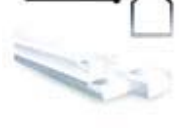
Clip Lock System