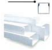
Clip Lock System